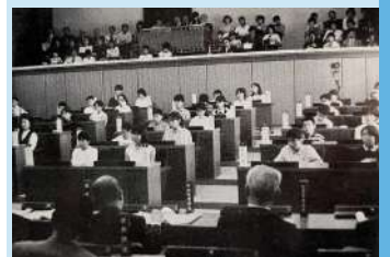
▲平成初期には目黒区でも実施